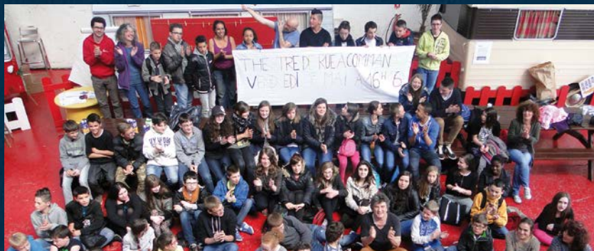
Les élèves du collège en visite au Fourneau

Aux portes des Monts d'Arrée, Commana compte un peu plus de 1 000 habitants et un collège avec lequel Le Fourneau est lié, depuis 2014, par un jumelage bien particulier. Cette année encore, tous les élèves vont s'immerger dans le processus de création d'une œuvre artistique. La rencontre avec les artistes, au sein du collège, est complétée par la collecte d'informations sur la commune, son histoire, ses particularités. Éveil aux arts, prises de vues photographiques, ateliers d'art clownesque, journal de bord multimédia, visite des locaux du Fourneau, découverte des compagnies en résidence et des « métiers » des Arts de la Rue fournissent des acquis qui ne tiennent pas dans les cartables mais s'échangent volontiers autour de la table familiale. Les chaînes de transmission se revisitent et enrichissent les liens inter-générationnels jusqu'à la présentation publique de la création dans le bourg, en fin d'année scolaire. De quoi laisser, dans tout le territoire, une « drôle d'impression », titre de la création de la compagnie Dédale de Clown au programme du collège cette année.