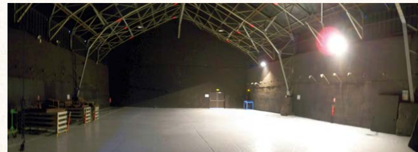
La grande Halle du Fourneau

Apportant toujours une réponse à chaque étape du travail de la compagnie, Le Fourneau s'efforce de rendre le temps de la résidence de création le plus efficace possible. Ses techniciens mettent à disposition le matériel nécessaire (son, éclairage, décors, accessoires,...), l'équipe administrative conseille et oriente (budget, structuration juridique et comptable, supports de communication), tandis que des bénévoles et salariés assurent l'intendance et la logistique de l'hébergement ou des repas. Et ceci selon un agenda bien rempli qui permettra, tout au long de l'année, de voir partir les créations vers d'autres aventures humaines.