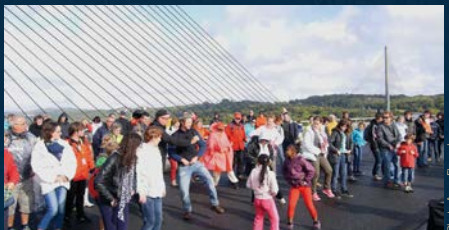
Pique-Nique sur le Pont 2015 : 300 personnes et un Américain dansent La « Dolly's corned beef stomp »

Venir à un rendez-vous artistique avec un panier d'osier sous le bras semblerait un rien saugrenu si Le Fourneau et la Ville de Le Relecq-Kerhuon n'avaient inventé les Pique-Niques Kerhorres ! Dans des sites insolites, naturels ou patrimoniaux, les Pique-Niques ponctuent l'été de moments conviviaux. En famille, entre collègues ou entre amis, on partage le repas mais, surtout, on se charge positivement d'émotions artistiques fortes. Avant ou après les spectacles, les nappes posées au milieu de l'espace public sont les points de rendez-vous. On se raconte, on ouvre grand les bras à son voisin et, promis, on se retrouvera vite car il faut sans cesse refaire ce nouveau monde, culturel et convivial, des Pique-Niques Kerhorres.