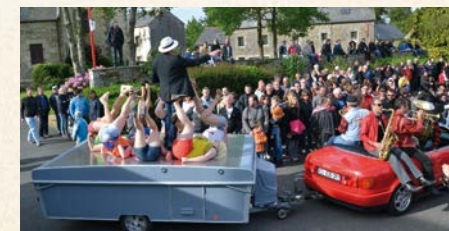
31 mai 2015 à Kersaint-Plabennec, Les Grooms présentent leur opéra de rue « Rigoletto »

Le Pays des Abers regroupe 13 communes, bordées au nord par la Manche et au sud par les portes de Brest. Ce territoire écrit, chaque année, une nouvelle histoire avec les habitants de 3 ou 4 des communes qui deviennent, aux beaux jours, les étapes du Printemps des Arts de la Rue. Les spectacles s'installent sur la petite place d'un bourg ou dans la grand-rue d'une ville. Comme la mer qui, ici, chaque jour, remonte la rivière, les habitants empruntent les routes de la CCPA et se fondent dans une joyeuse marée humaine. Cirque, théâtre ou musique écrivent une nouvelle tradition, à chaque printemps renouvelée, avec la complicité des élus et des associations locales.