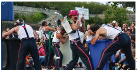
Les Urbaindigènes présentent «La Revue Militaire» sur le Port de Brest le jeudi 6 août 2015

Les Jeudis du Port sont désormais une institution dont la renommée dépasse largement le Pays de Brest. Les jeudis d'été, les quais du port de commerce font la part belle au spectacle vivant. Les brestoïses et touristes profitent d'une programmation spécifique d'Arts de la rue. Associé à la Ville de Brest, Le Fourneau invite des compagnies à présenter leurs dernières créations ou des spectacles de répertoire. À deux pas des quais gorgés de monde, des sites surprenants invitent à un tout autre voyage : le Parc à Chaînes, le Jardin de l'Académie... La programmation poétique et exigeante, sensible ou grinçante, intimiste ou monumentale, entraîne petits et grands dans un univers de poésie, de dérision et d'humour. Des moments exceptionnels qui se déguisent en fin de journée ou à la tombée de la nuit.