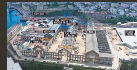
Octobre 2015, 15 000 métropolitains visitent les coulisses du chantier des Capucins

Bien avant d'y installer ses locaux au sein des Ateliers des Capucins, Le Fourneau s'est engagé dans une démarche d'appropriation de ce nouveau quartier par les habitants du Pays de Brest. Depuis 2011, les 5 éditions de la Marche des Capucins ont réuni plus de 80 000 personnes qui suivent, étape par étape, le gigantesque chantier. Bien avant l'installation du Fourneau 3 au cœur des Ateliers des Capucins, l'équipe du Centre National y fabrique avec les habitants de la Métropole des empreintes, des traces aussi durables dans les mémoires que si elles étaient inscrites dans une dalle de béton frais.