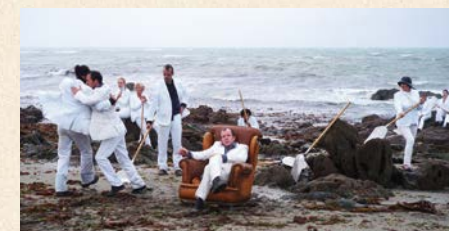
Mercredi 26 août, 7h12 du matin à Moëlan-sur-Mer, les G.Bistaki inaugurent les Rias 2015

Entre l'océan Atlantique et le Centre-Bretagne, la COCOPAQ (Communauté de Communes du Pays de Quimper) rassemble 16 communes sur un territoire riche d'un patrimoine exceptionnel, d'une multitude de cours d'eau et de profondes rias. Ici, la fin des vacances estivales rime avec Festival. Les Rias est devenu, en 4 ans, le plus grand événement d'Arts de la rue de Bretagne. C'est une extraordinaire aventure que vivent plus de 60 000 spectateurs, dans des sites toujours remarquables : une prairie, une chapelle dans son écrin de verdure, le cœur d'une ville, un front de mer, ... Accompagnés par la Chimère, mi-homme mi-poisson, les festivaliers se retrouvent ou se croisent au gré de 50 rendez-vous à ciel ouvert.