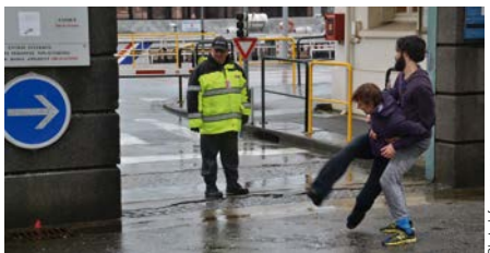
La débordante Compagnie et son «Rassemblement» devant la porte de l'Arsenal Jean Bart le 26 février 2015

Depuis 2012, Le Fourneau s'associe au Quartz - Scène Nationale de Brest à l'occasion du Festival DañsFabrik. Durant une semaine, grâce à une programmation artistique de qualité, l'espace public brestoïse se transforme sous les yeux des habitants. Danser dans la rue ou sur une place, aux frontières du public et du privé, questionne et permet de se jouer des codes et des normes, de revisiter l'environnement quotidien. C'est toute une ville qui se met en mouvement. Autour d'une vingtaine de propositions chorégraphiques, de conférences et de performances dans des lieux improbables, des étudiants, écoliers ou simples citoyens rejoignent les danseurs. Chaque parcelle de la ville devient un terrain de jeu pour célébrer une culture partagée et universelle, le langage des corps.