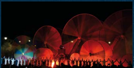
La Compagnie Off et ses « Roues de Couleurs » au Temps Bourg 2015

L'arrivée de l'été est l'occasion, pour les habitants de Guipavas et d'ailleurs, d'embarquer dans un voyage artistique riche en émotions. Le Temps Bourg est désormais LE rendez-vous monumental du 1er samedi de juillet, grâce à une belle complicité entre la commune et Le Fourneau. Autour d'une compagnie de renommée internationale, invitée à présenter une création de taille monumentale, c'est toute une population qui s'active. Avec le soutien de la vie associative locale, les volontaires y deviennent figurants, accessoiristes ou acteurs de la convivialité et de l'accueil du public. Les rues se transforment, l'imaginaire des artistes franchit le pas des portes pour entraîner les habitants dans un tourbillon de douce folie. Festif, familial et convivial, le Temps Bourg résonne désormais dans tout le Pays de Brest.